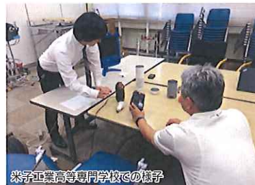
米子工業高等専門学校での様子

当社は、地元山陰の高等専門学校や高等学校、企業、施設、飲食店などと連携し、音声対話サービスでどんなことができるか、共同で研究を行っています。